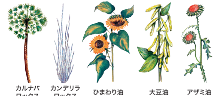
自然塗料オスモカラー